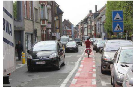
Duim omhoog: de fietsstrook op de Moorselbaan.

AALST - SCHEPEN EN FIETSERSBOND RAZEND AMBITIEUS ONDANKS DEBACLE VAN DIT JAAR